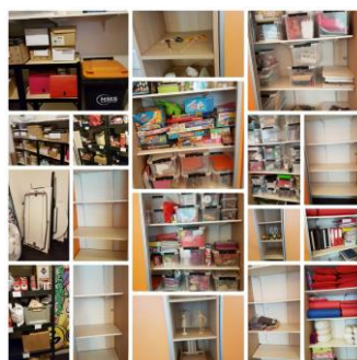
Figuur 1 Na