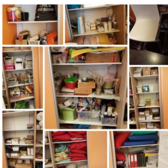
Figuur 2 Voor